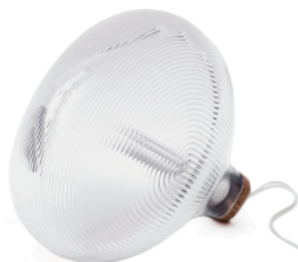
TIDELIGHT PIERRE FAVRESSE LAMPE À POSER